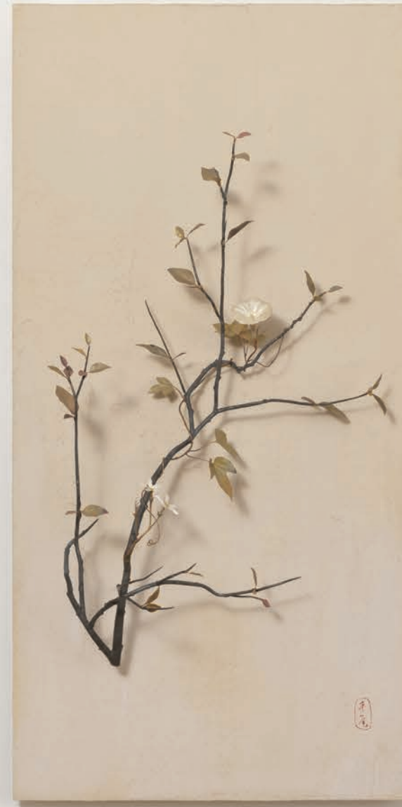
2022年度 修了作品優秀賞 「〇△□」より 「〇」、「△」 [表紙] 〇: H1300mm x W500mm x D200mm 銀、銅、鉄、金箔漆喰塗りポード [裏表紙] △: H1000mm x W500mm x D200mm 銀、銅、鉄、金箔、漆喰塗りポード